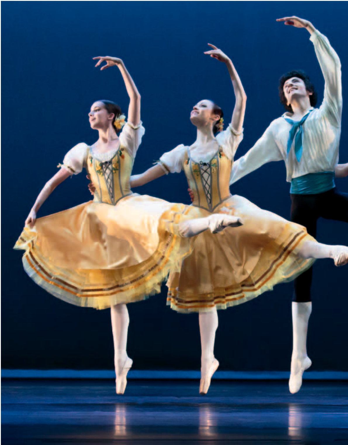
La Vivandière – Pas de Six. Het Nationale Ballet Junior Company.