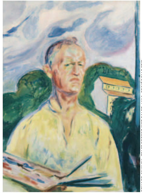
EDVARD MUNCH, ZELFPORTRET MET PALET, 1926. PRIVÉCOLLECTIE

'Munch: Van Gogh'. De tentoonstelling in het Van Gogh Museum, Amsterdam werd mede mogelijk gemaakt door het Blockbusterfonds