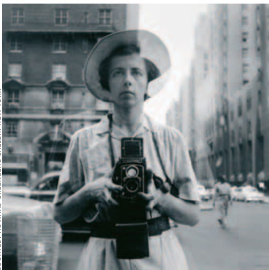
New York, 10 september 1955

In 2001 opende het Fotografiemuseum Amsterdam, beter bekend als Foam, zijn deuren aan de Keizersgracht. Sindsdien ontwikkelde het museum zich tot een internationale instelling met een heel eigen identiteit. Foam is continu op zoek naar nieuwe mogelijkheden om publiek te bereiken en ontplooit tal van activiteiten om de veelzijdigheid van het medium fotografie te laten zien. Samen met twee andere partijen startte Foam in 2012 met Unseen , een jaarlijkse internationale fotografiebeurs waar vooraanstaande galleries uit binnen- en buitenland nieuw werk presenteren van jonge, aanstormende talenten. In 2013 startte Foam, in samenwerking met Fotomuseum Rotterdam,