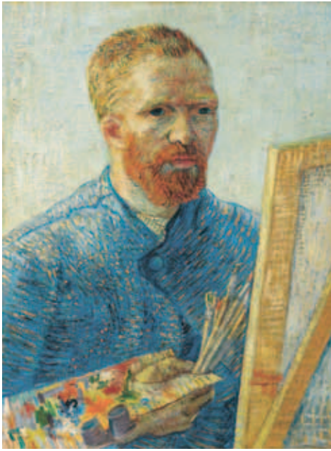
VINCENT VAN GOGH, ZELFPORTRET ALS SCHILDER, 1887-1888. VAN GOGH MUSEUM, AMSTERDAM (VINCENT VAN GOGH STICHTING)