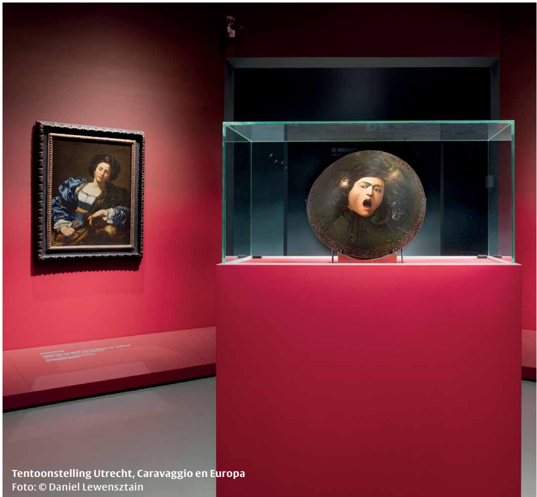
Tentoonstelling Utrecht, Caravaggio en Europa