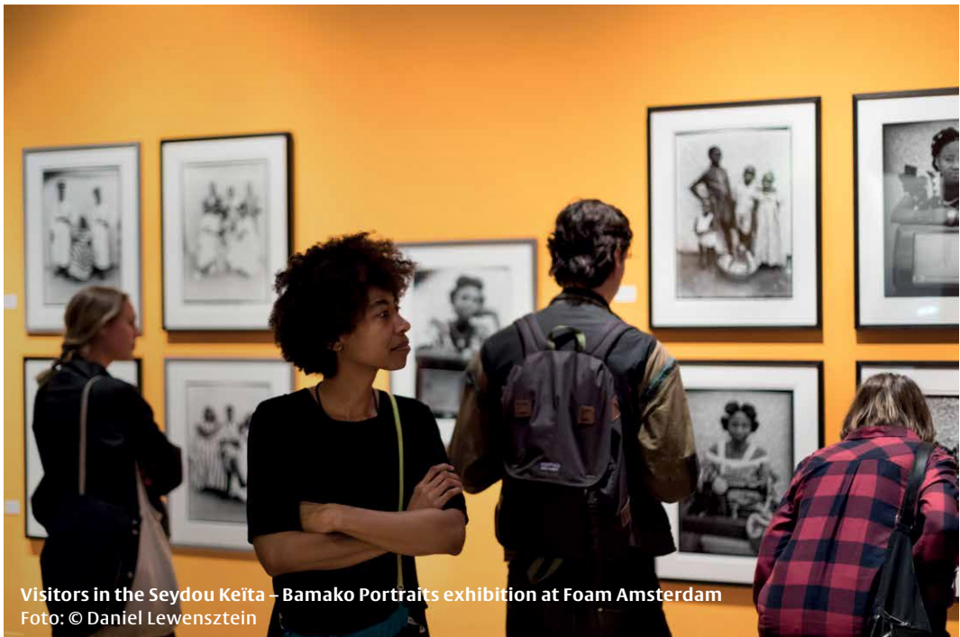
Visitors in the Seydou Keita – Bamako Portraits exhibition at Foam Amsterdam

Ter gelegenheid van de voorstellingenreeks van de musicalproductie Lazarus in het DeLaMar Theater werd het theater tijdelijk voorzien van een op deze productie toegespitste fototoonstelling. Hiervoor is gebruik gemaakt van vijftien foto's van fotograaf Bernard Rübsamen.