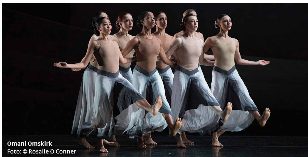
Omani Omskirk