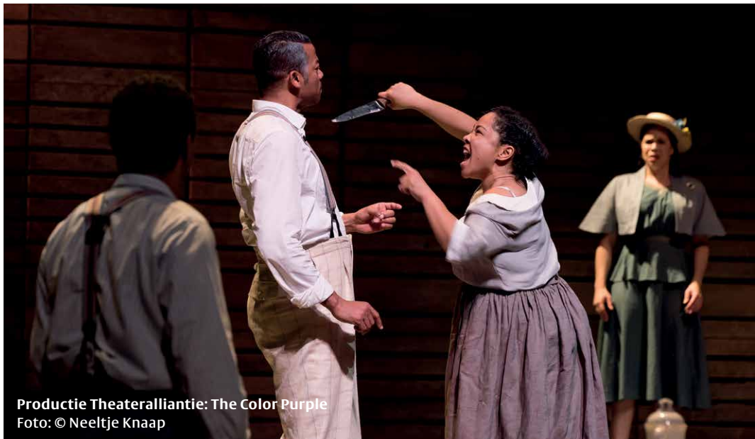
Productie Theateralliantie: The Color Purple