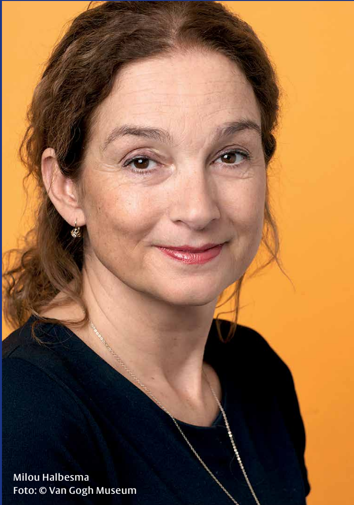
Milou Halbesma