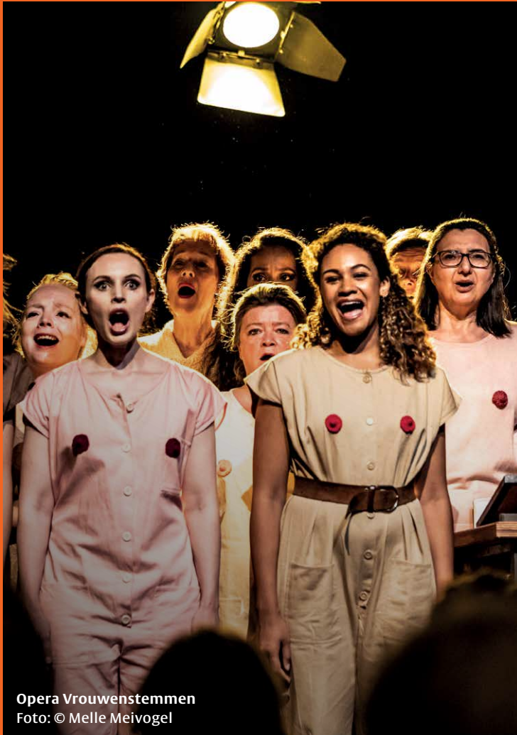
Opera Vrouwenstemmen