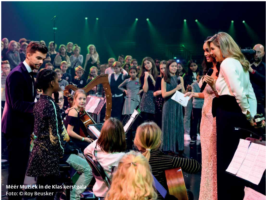
Méer Muziek in de Klas kerstgala

In 2015 waren de ambities voor 2020: structureel muziekonderwijs op alle scholen, in alle leerjaren. Idealiter zou Méer Muziek in de Klas zich na vijf jaar weer opheffen. De werkelijkheid was weerbarstiger dan in 2014/2015 ingeschat. De stichting heeft de afgelopen jaren grote stappen kunnen zetten in de richting van zijn doel.