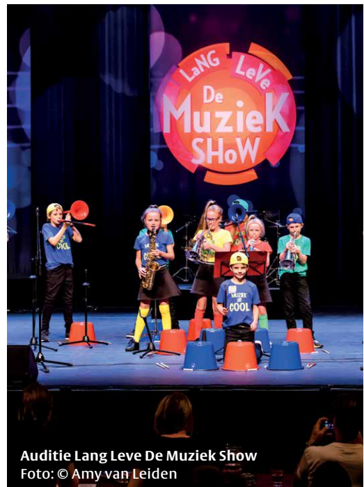
Auditie Lang Leve De Muziek Show

Opdat we uiteindelijk van Méér Muziek in de Klas, naar Nóg Méér Muziek in de Klas kunnen gaan.'