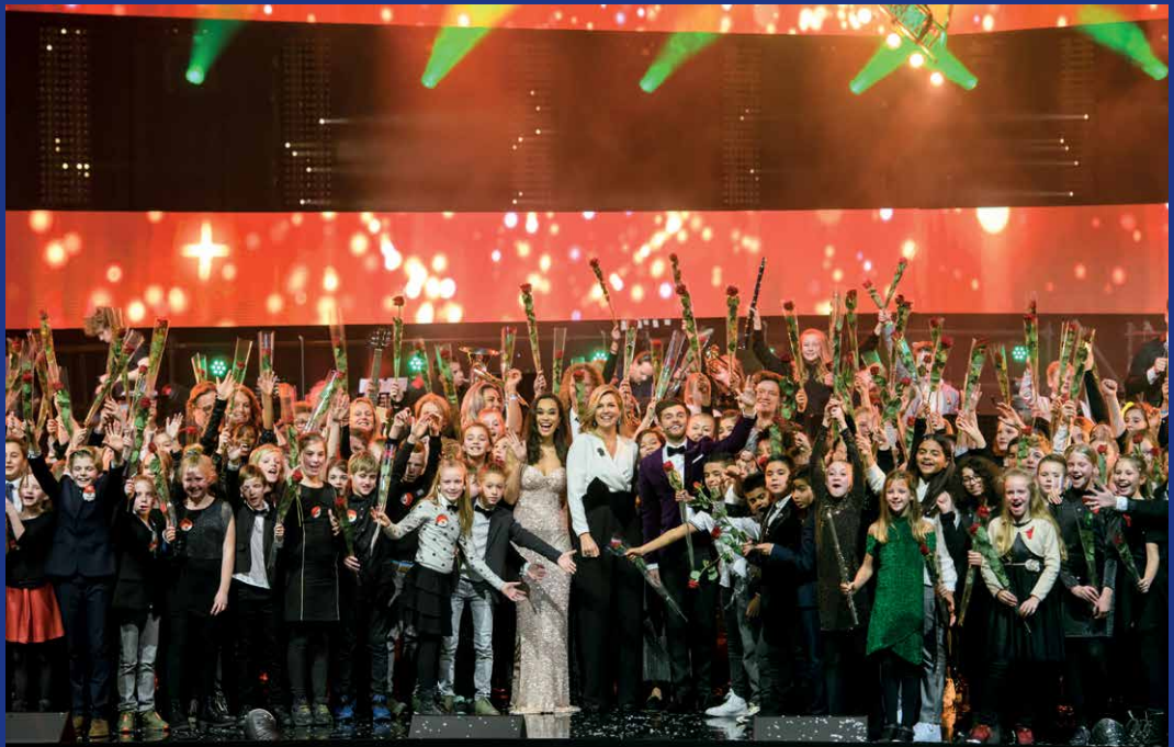
Méér Muziek in de Klas kerstgala