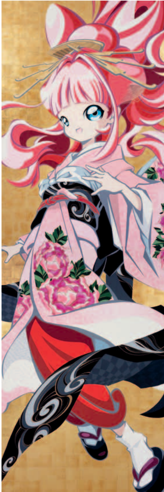
UKI-UKI. ACRYL OP DOEKEN BLADGOUD 2012 - KUNSTENAAR MATSUURA HIROYUKI (1964-) - BRUIKLEEN TOKYO GALLERY BTAP

Tentoonstelling 'Cool Japan', mede mogelijk gemaakt door het Blockbusterfonds