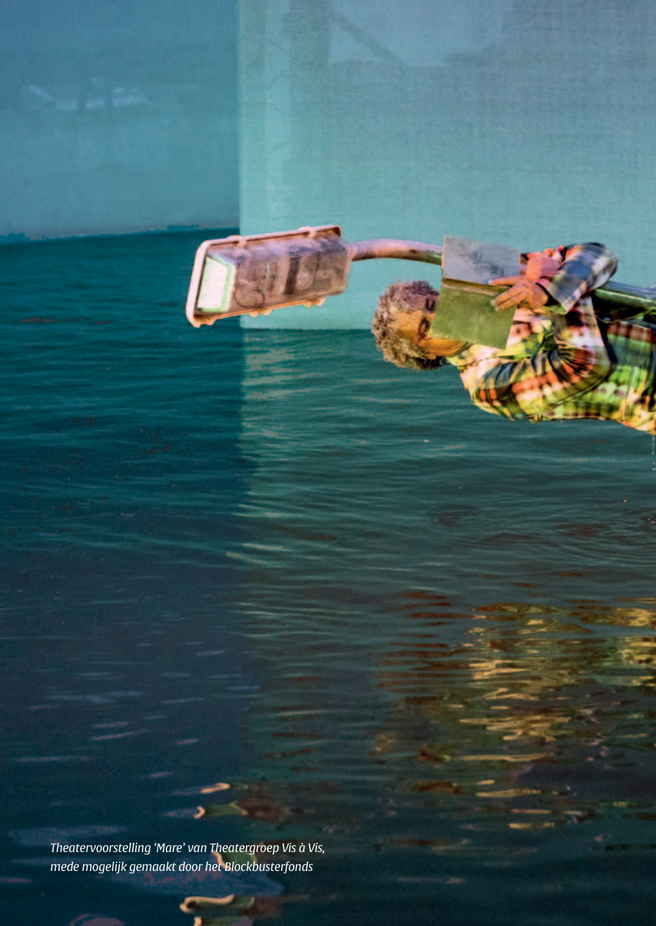
Theatervoorstelling 'Mare' van Theatergroep Vis à Vis, mede mogelijk gemaakt door het Blockbusterfonds