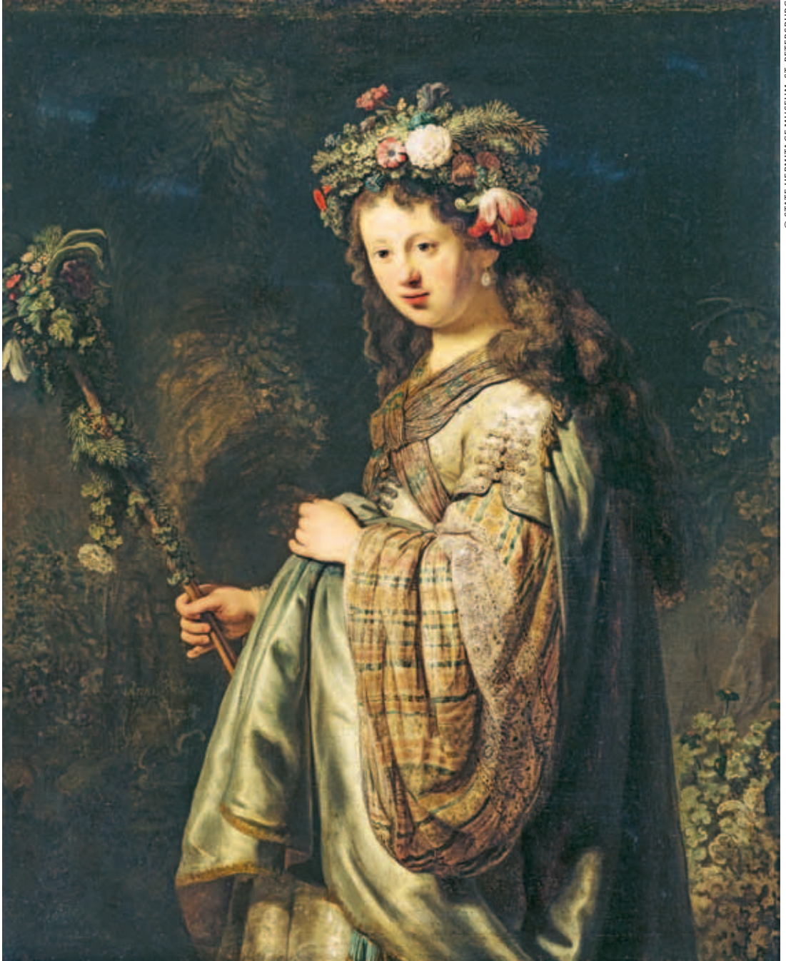
Hollandse Meesters in de Hermitage: Rembrandt van Rijn, Flora, 1634