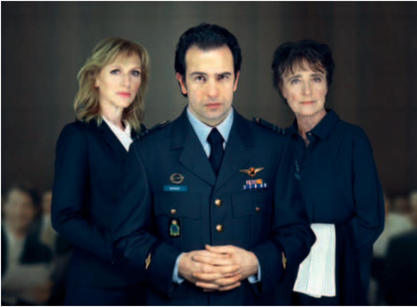
Johanna ter Steege, Jeroen Spitzenberger en Clairy Polak in 'Terror'

Nieuwe Familie van en met Sanne Vogel. In deze voorstelling vertelt zij over hoe het voor haar was om twee jonge Syrische vluchtelingen als logees op een luchtbed in haar woonkamer te hebben.