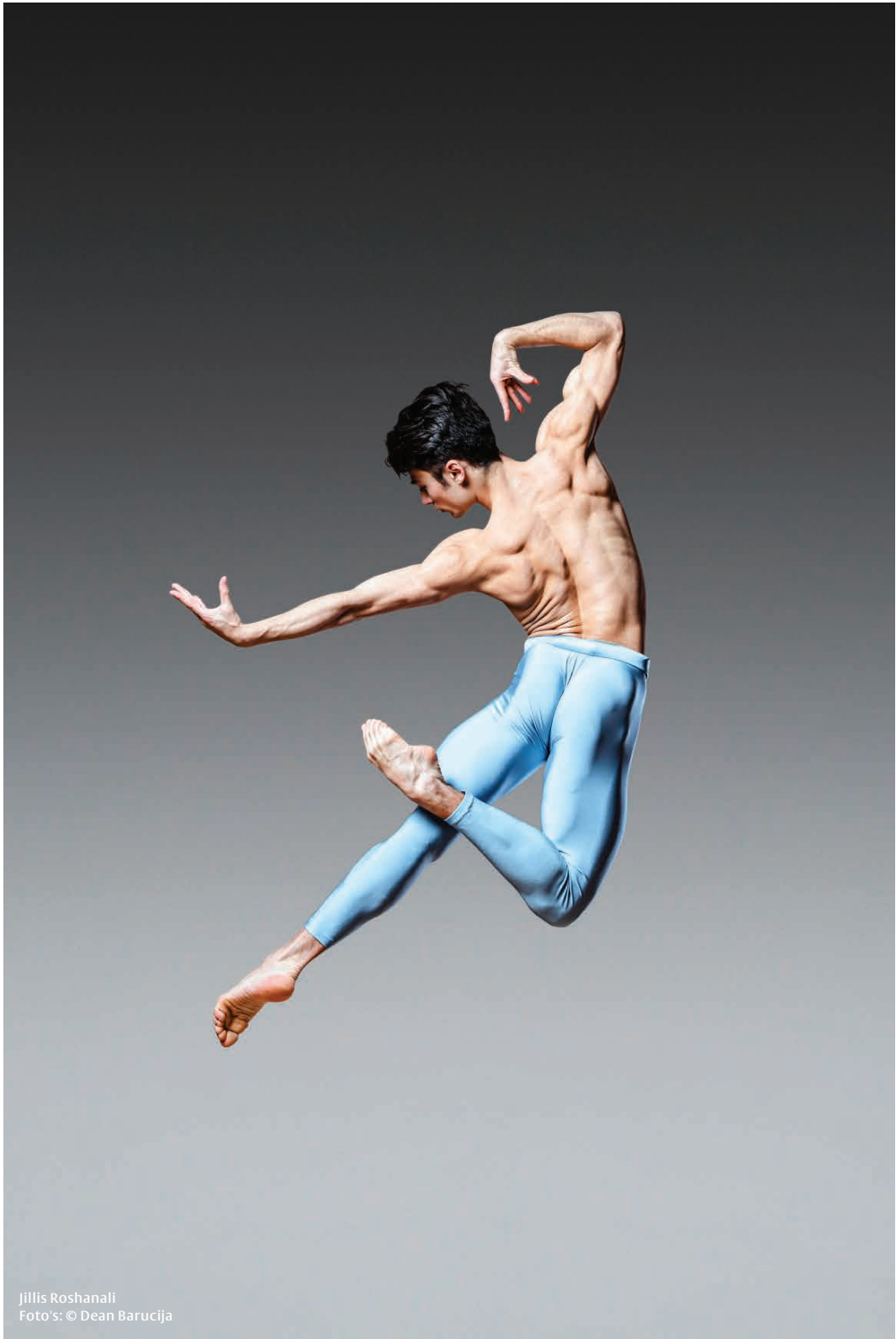
Jillis Roshanali