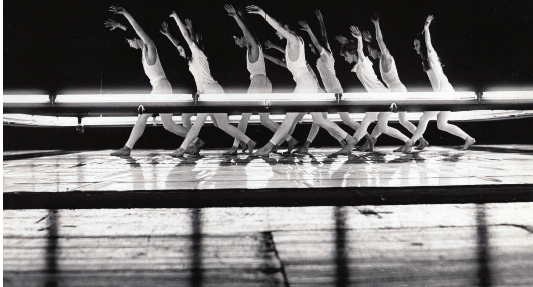
NDT SINFONIETTA 1978