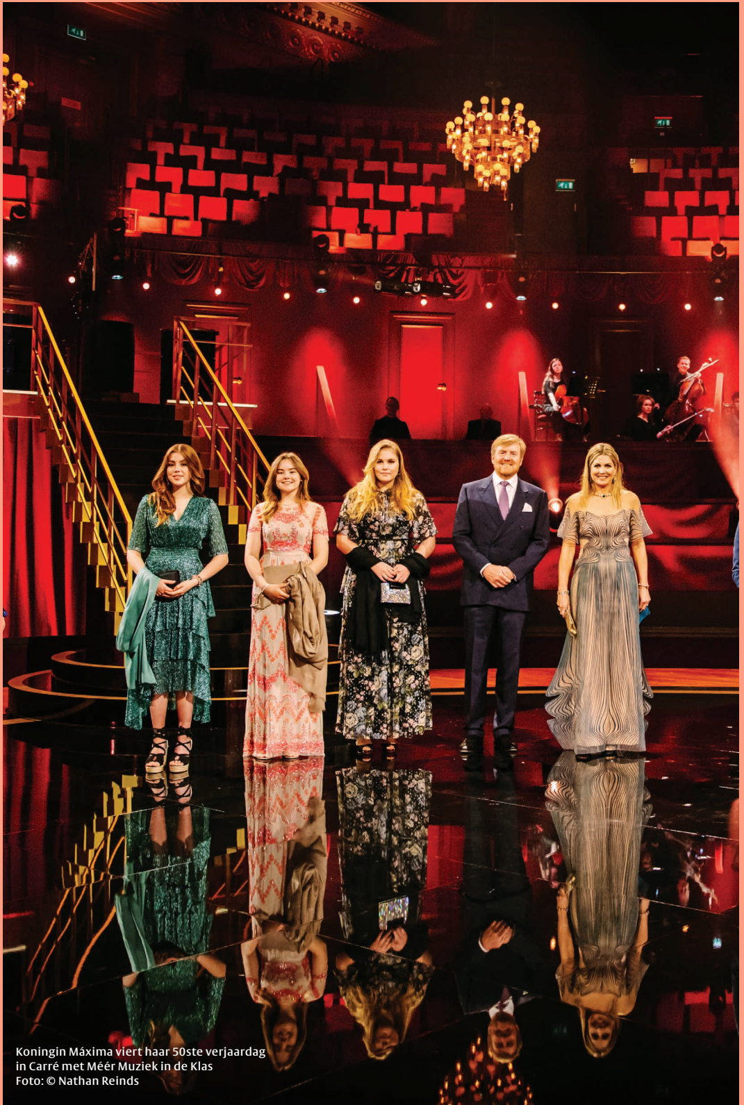
Koningin Máxima viert haar 50ste verjaardag in Carré met Méér Muziek in de Klas