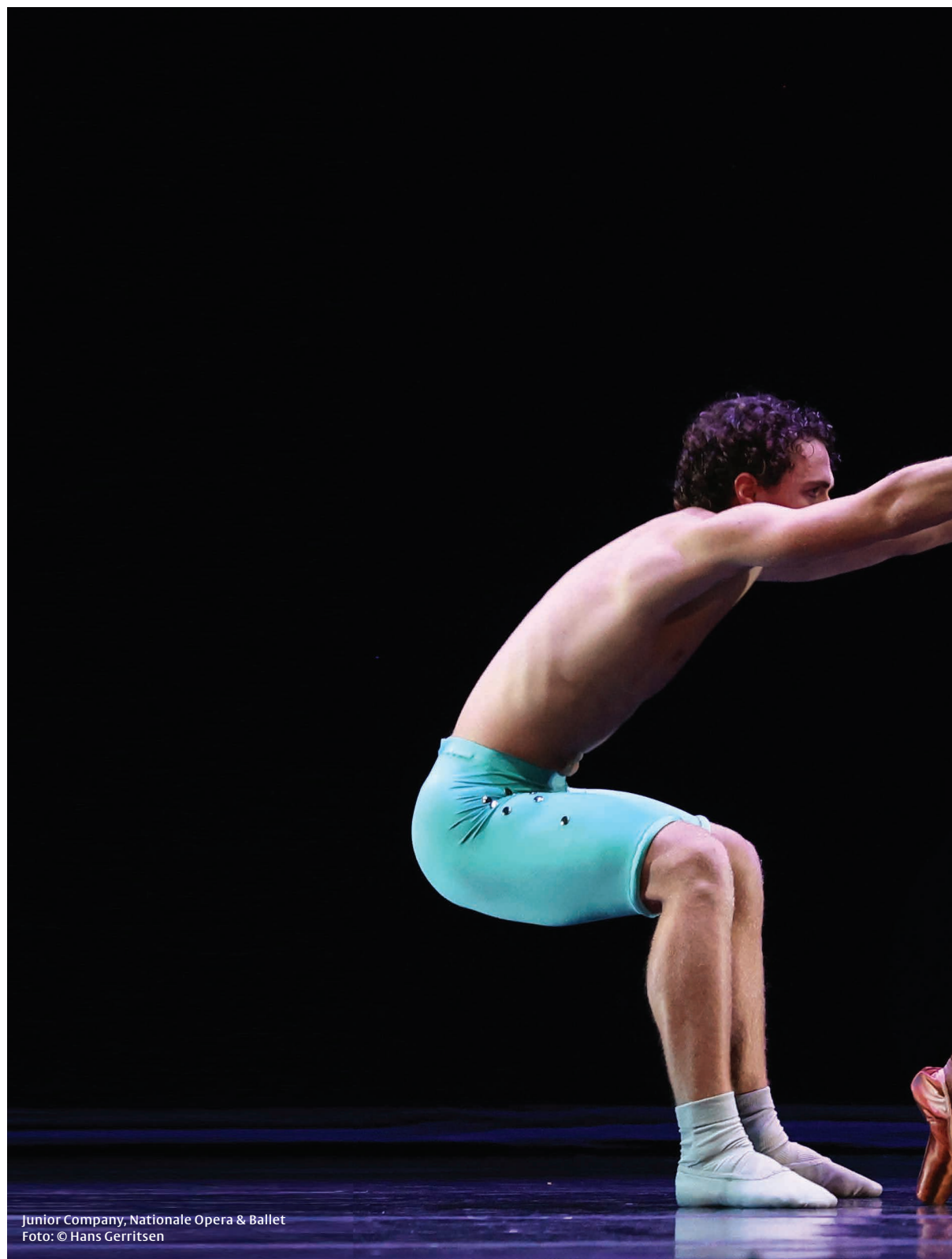
Junior Company, Nationale Opera & Ballet