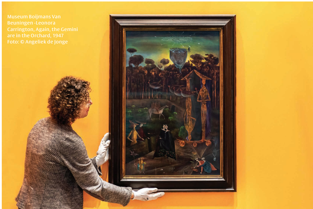
Museum Bolijmans Van Beuningen -Leonora Carrington, Again, the Gemini are in the Orchard, 1947

budget voor te kunnen vrijmaken. Uit die kiem ontstaat in 2012 de samenwerking tussen het Prins Bernhard Cultuurfonds, het VSBfonds, de VandenEnde Foundation en de BankGiro Loterij, oftewel het Blockbusterfonds.