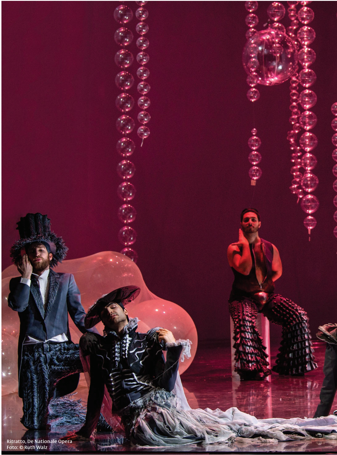
Ritratto, De Nationale Opera